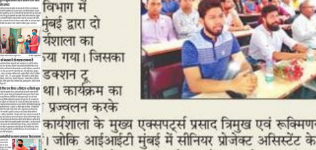
एमआईटी कार्नेम में कार्यशाळा के बाद प्रदर्शकों को सम्मानित करते।