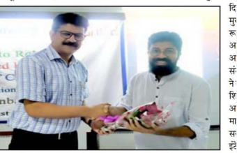
विभाग में ई-यंत्र, आईआईटी मुंबई उद्देश्य आईआईटी मुंबई द्वारा