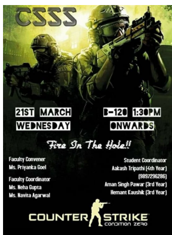
3. COUNTER STRIKE (21-03-2018)