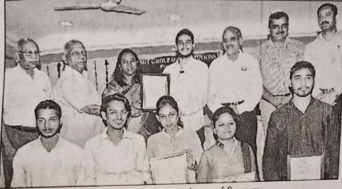
एमआईटी में युवा एंटरप्रेन्योर्स को सम्मानित करते एमआईटी स्टाफ।