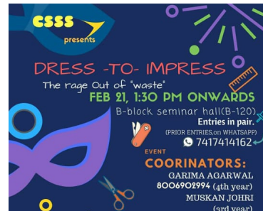
2. DRESS TO IMPRESS (21-02-2018)