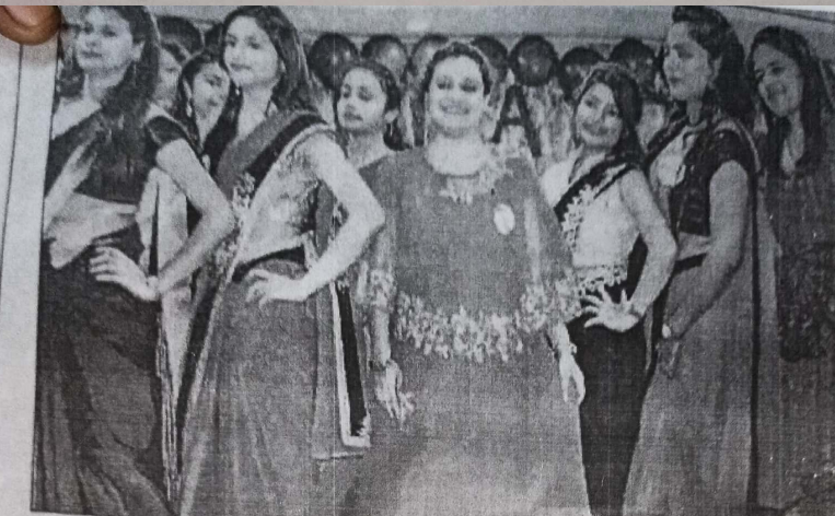
एमआईटी में मंगलवार को विदाई समारोह में प्रस्तुति देते छात्र-छात्राएं।

उपकरणों को भी घर से दूना छोड़ दिया है तो आप न केवल घर के बाहर अपितु शहर के बाहर भी रहकर उन्हें नियंत्रित कर सकते हैं साथ ही साथ छात्रों द्वारा बनाया गया यह उपकरण घर को सुरक्षा बढ़ाने में भी सक्षम है। इसमें छात्रों ने एक ऐसा उपकरण का प्रयोग किया है जिसमें यदि आपके घर में कोई भी घुसने की कोशिश करता है तो आपके