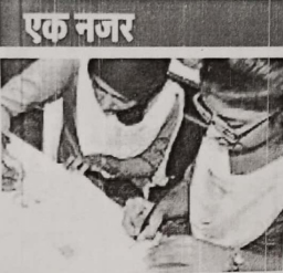
इंजीनियरिंग छात्राओं ने एमआईटी में प्रतीक चिह्न बनाकर रचनात्मकता का प्रदर्शन किया।