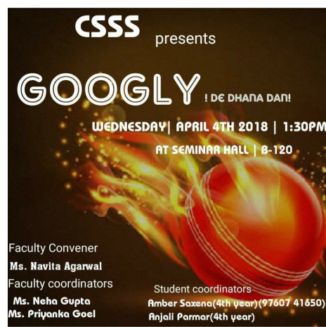
4. GOOGLY (04-04-2018)