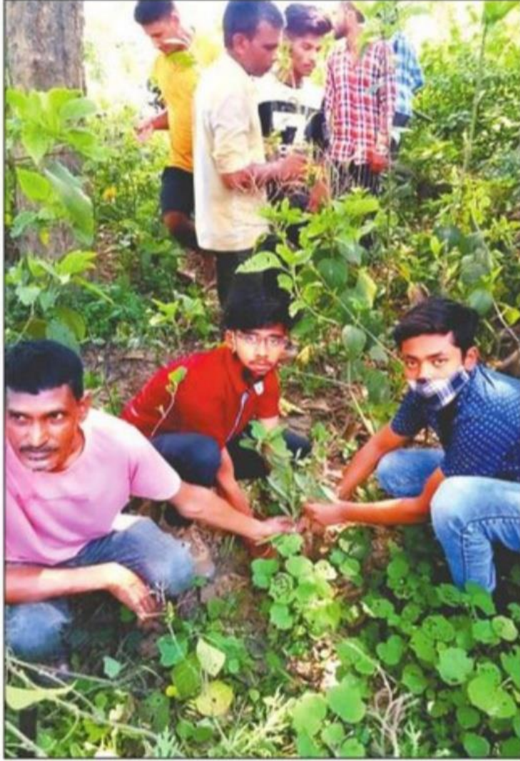
मुरादाबाद इंस्टीट्यूट ऑफ टेक्नोलॉजी की राष्ट्रीय सेवा योजना इकाई द्वारा किया गया पौधरोपण।